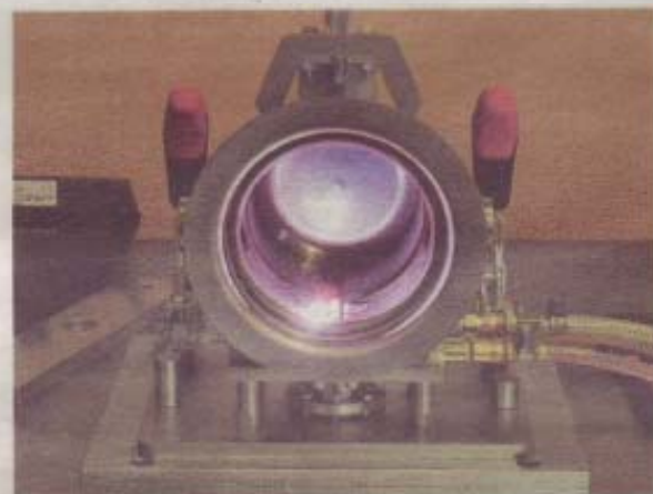
Automatisk TIG-svetsning av en rostfri brunn som sitter i fixturen på arbetsbordet i den automatiserade anläggningen.